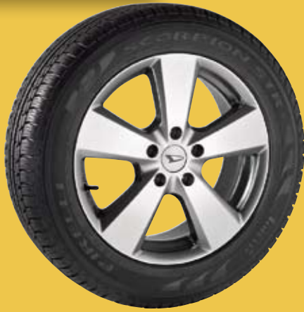
Leichtmetallrad 7 x 17" * Chromglanzlackierung. Mit Bereifung 235/55 R17 Artikel-Nr. 42611-18218