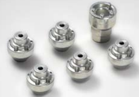
Radsicherung für Leichtmetallräder abschließbar Artikel-Nr. 42612-87601-000