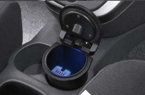
Aschenbecher Solarbetrieben, schwarz, blaue Beleuchtung Artikel-Nr. 08623-B2001