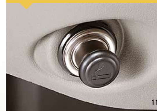
Zigarettenanzünder Nachrüst-Kit Artikel-Nr. 08621-B4000-100