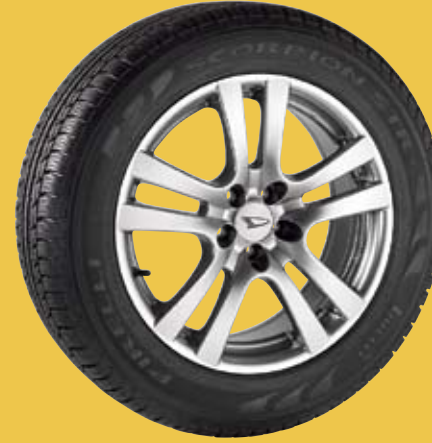
Leichtmetallrad 7 x 16" * für Serienbereifung. Chromglanzlackierung. Artikel-Nr. 42611-08216