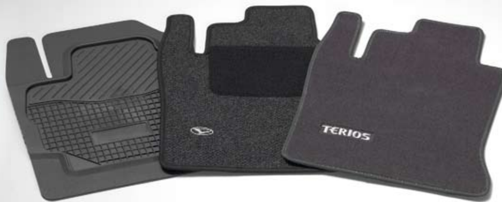
Fußmattensatz Gummi 4-teilig Artikel-Nr. 58500-83215-110