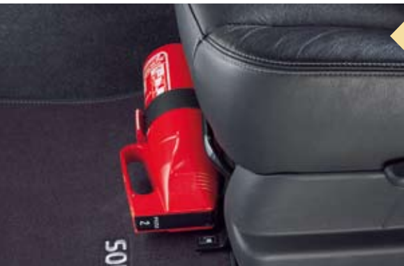
Feuerlöscher mit Halterung, 1 kg Füllung Artikel-Nr. 99910-30040