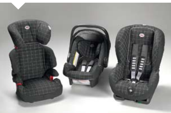
Kindersitze RÖMER BABY SAFE plus Gruppe 0+ ( 0-13kg ) Artikel-Nr. 71400-87315-100 RÖMER DUO PLUS mit Isofix-Befestigung, Gruppe I ( 9-18 kg ) Artikel-Nr. 71400-87316-100 RÖMER KID Gruppe II - III (15-36 kg) Artikel-Nr. 71400-87317-100