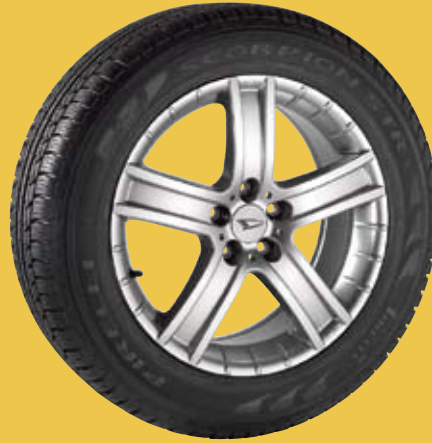
Leichtmetallrad 7,5 x 17" * Chromglanzlackierung. Mit Bereifung 235/55 R17 Artikel-Nr. 42611-18217